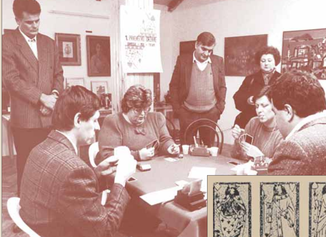
Lijevo: Državno prvenstvo u bridžu 1985. godine